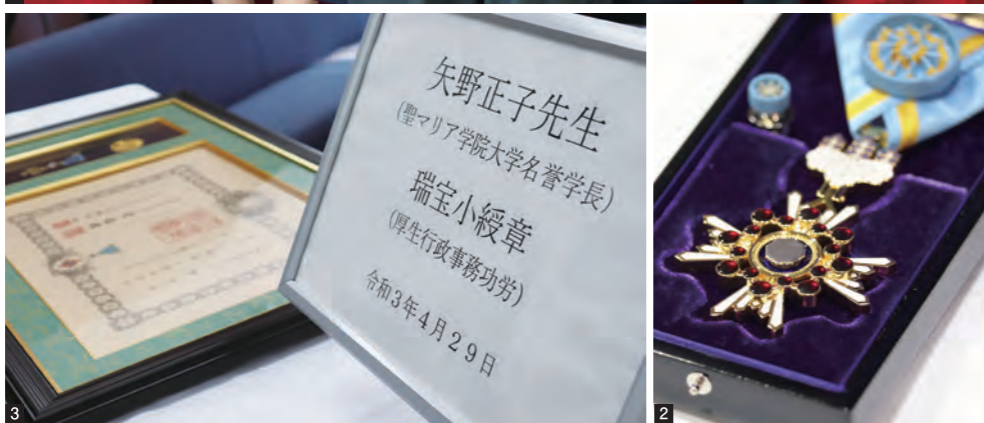
1 歴代学長が集い、矢野名誉学長の受章に祝意を表しました。【(左)井手信学院長(初代学長)、(中央)矢野名誉学長(第2代学長)、(右)井手三郎学長(第3代学長)】 2 瑞宝小綬章 勲章 3 受章お披露目会の様子