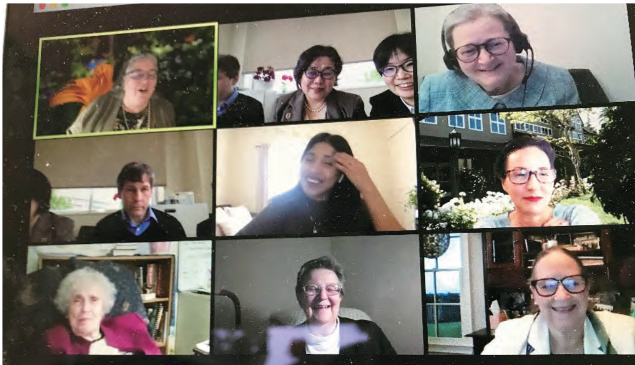
ヴァーチャルカンファレンスの様子

今後も学生の皆さんと共にRoy Adaptation Model: Contributions to Authentic Nursing Knowledgeの探求を継続していく所存です。